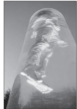
Verspielt-poetischer Unterwassertanz am Aarauer Festival für Zeitgenössischen Zirkus.

Der Verein «cirqu'Aarau» präsentiert in Zusammenarbeit mit dem Theater Tuchlaube Aarau das erste Aarauer Festival für Zeitgenössischen Zirkus: «cirqu'4» findet vom Mittwoch, 24. bis Sonntag, 28. Juni in der Alten Reithalle Aarau statt und fasst drei internationale Inszenierungen zu einem faszinierenden und berührenden Abend zusammen.